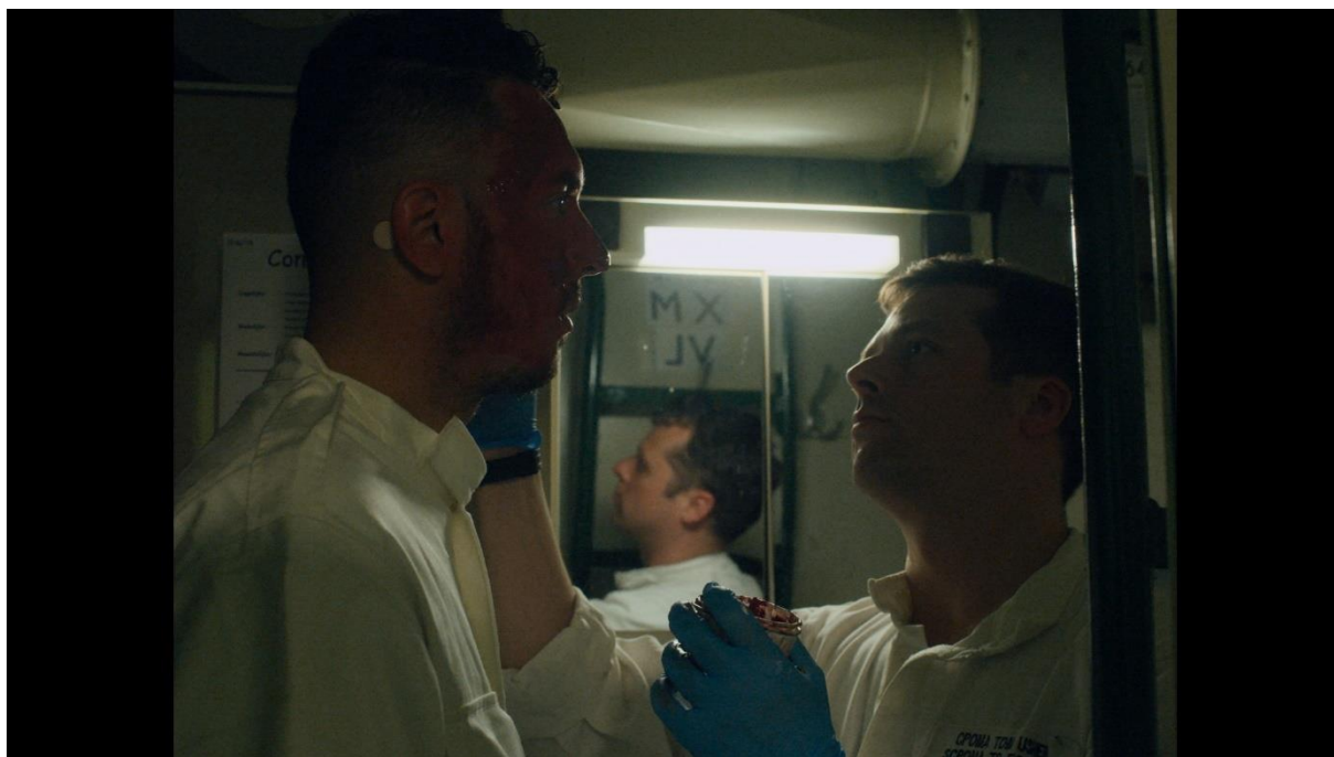
Připravit se! (režie: Daphne van den Blink)

Belgický observační dokument Připravit se! v režii Daphne van den Blink sleduje skupinu mladých námořníků na palubě lodi Louise-Marie během klíčového výcviku NATO. V prostředí uzavřeného vojenského mikrosvěta se zrcadlí napětí mezi povinnostmi, rutinou a lidskostí. Režisérka zachycuje každodennost vojáků, kteří „stále čekají na rozkaz“ – v nepřetržité pohotovosti, jež se stává psychickou i morální zkouškou. Z banálních úkonů, únavy a ticha mezi poplarchy se postupně skládá obraz války, která sice neprobíhá, ale neustále se nacvičuje.