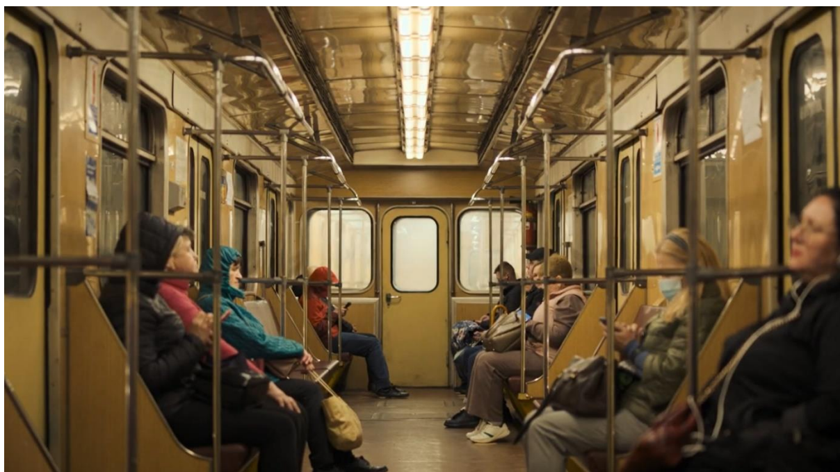
Znělka 29. MFDF Ji.hlava (režie: Sergej Loznica)

„Záběry pocházejí z materiálu natočeného na jaře roku 2023 v rámci projektu The Invasion . Chtěl jsem zachytit život obyčejných Ukrajinců po celé zemi – od Charkova po Lvov, od Kyjeva po Oděsu – a pozorovat, jak válka ovlivňuje každý aspekt civilního života a proměňuje jednotlivce i společnost jako celek,“ vysvětluje Loznica. „Jak víme, v době války slouží stanice metra ve velkých ukrajinských městech – v Kyjevě, Charkově i Dnipru – jako protiletectvé kryty. Na jedné straně tedy vidíme zcela běžnou, každodenní scénu: lidé vstupují do metra během ranní špičky a spěchají za svými povinnostmi. Na druhé straně ale víme, že tuto rutinní ranní situaci může kdykoli přerušit letecký poplach,“ dodává režisér, jehož filmy pravidelně soutěží na nejprestižnějších festivalech světa – od Cannes přes Benátky až po Berlinale – patří mezi nejuznávanější současné evropské dokumentaristy.