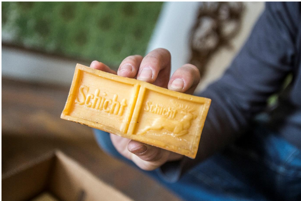
Království mýdlových bublin (režie: Taťána Marková)

Dokument Velký vlastenecký výlet Robina Kvapila sleduje dva Čechy a jednu Češku, kteří půl století po okupaci Československa vyrážejí opačným směrem – na Ukrajinu. Chtějí na vlastní oči vidět válku, o níž si „myslí své“. Tragikomická road movie, natočená uprostřed bombardované krajiny, je nejen emotivním svědectvím o odvaze Ukrajinců, ale i ostrou reflexí toho, že nám často víc než na cizích životech záleží na vlastní pravdě.