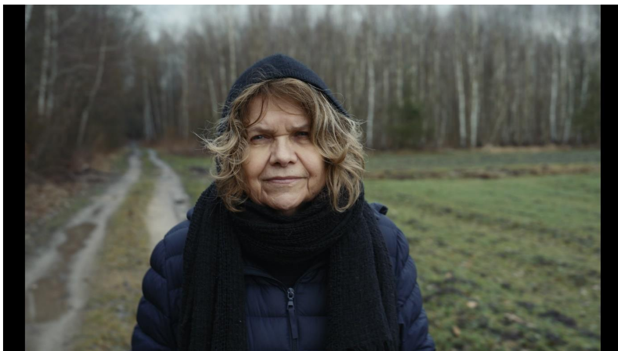
Polsko proti dějinám (režie: Joanna Grudzinská)

Snímek Polsko proti dějinám polské herečky a režisérky Joanny Grudzinské zkoumá dopady kontroverzní knihy Jana Tomasze Grosse Sousedé , která odhalila, že pogrom ve vesnici Jedwabne v roce 1941 nebyl dílem Němců, ale místních obyvatel. Film zároveň mapuje další tragédie, například pogromy v Radzilowě či poválečné události v Kielcích v roce 1946, a otevírá diskusi o historické paměti, kolektivní odpovědnosti a zakořeněném antisemitismu. Prostřednictvím svědectví přeživších a archivních materiálů snímek ukazuje, jak obtížně se polská společnost vyrovnává s vlastní minulostí a jak historie formuje současnou identitu i morální reflexi.